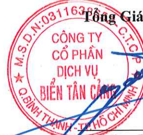
Lê Đăng Phúc

Thuyết minh báo cáo tài chính hợp nhất từ trang 9 đến trang 35 là một bộ phận hợp thành và đọc cùng báo cáo này